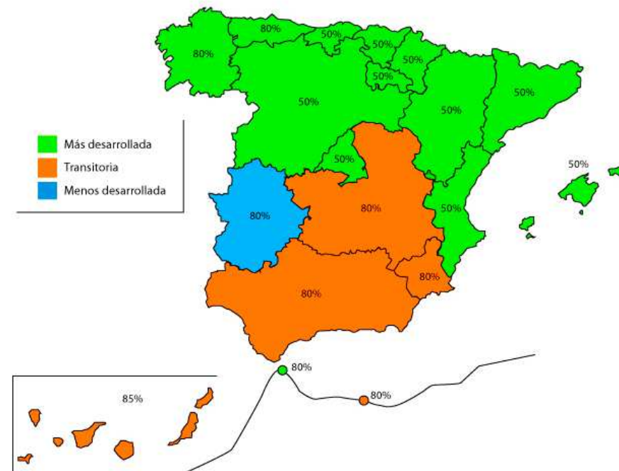
Tasas de cofinanciación del FSE en España

En Aragón la tasa de cofinanciación es el 50% (mas desarrollada).